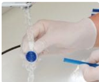
Abb. 7: gebrauchten TS1 gründlich abspülen

In der Praxis darf der TS1 Zungensauger nur als Einwegprodukt angewendet werden. Zusammen mit dem TS1 Handgriff ist er die ideale Ergänzung, um das Thema Zungenreinigung auch zu Hause fortzuführen – und gleichzeitig eine Möglichkeit, den TS1 nachhaltig zu verwenden.