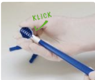
Abb. 8: TS1 auf den TS1 Handgriff aufstecken