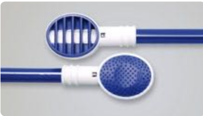
Abb. 1: TS1 Zungensauger Lamellenseite zum Absaugen, Noppenseite zum Einmassieren eines Reinigungsgels