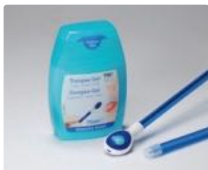
Abb. 6: TS1 Zungen Gel

Für ein lang anhaltendes Frische- und Sauberkeitsgefühl.