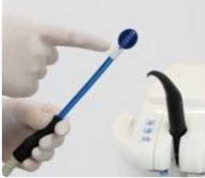
Abb. 2: TS1 Zungensauger aufstecken

Der TS1 Zungensauger ist durch sein einfaches Handling bestens geeignet für alle Prophylaxe-Fachkräfte: Einfach auf den Speichelsauger aufstecken und schon kann es losgehen. Es bedarf keiner weiteren Einweisung.