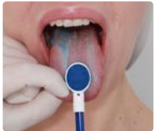
Abb. 5: Mit der Lamellenseite die Zungenoberfläche absaugen-fertig!

Das Ergebnis einer Zungenreinigung ist für Sie unmittelbar sichtbar. Wie bei einem hochflorigen Teppich, den Sie mit einem Staubsauger reinigen, sehen Sie die gereinigte Fläche, nachdem Sie mit der Lamellenseite des TS1 Zungensaugers darüber gefahren sind.