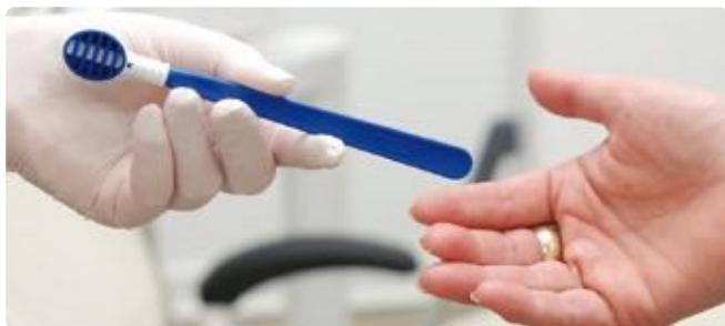
Abb. 9: Ein vollwertiger TS1 Comfort-Zungenreiniger für zu Hause