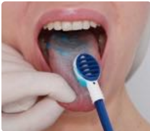
Abb. 4: Mit der Noppenseite Gel auf die Zunge auftragen