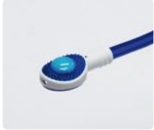
Abb. 3: Gel auf die genoppte Seite geben